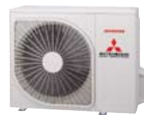
SRC 45 ZMP-S