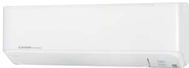
SRK 25~45 ZMP-S