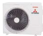
SRC 25~35 ZMP-S